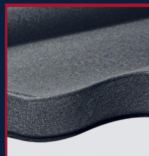
PODWINIĘCIĘ DOLNEJ KRAWĘDZI ARKUSZA