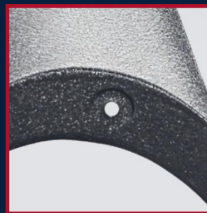
FABRYCZNIE PRZYGOTOWANE OTWORY I MISECZKI