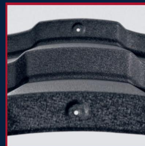
PODŁOCZENIE WZDŁUŻ PRZETŁOCZEŃ