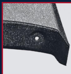
FABRYCZNIE PRZYGOTOWANE OTWORY I MISECZKI