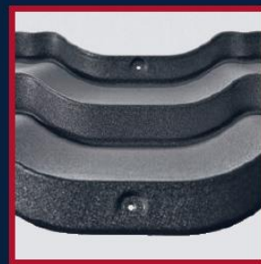
PODŁOŻENIE WZDŁUŻ PRZETŁOCZEŃ