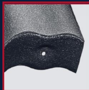
FABRYCZNIE PRZYGOTOWANE OTWORY I MISECZKI