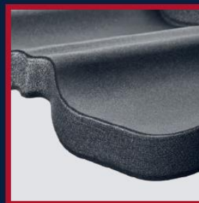
PODWINIĘCIE DOLNEJ KRAWĘDZI ARKUSZA